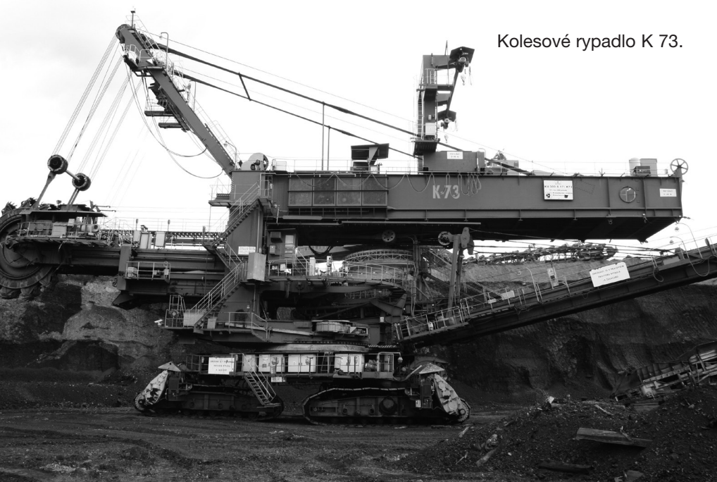
Kolesové rypadlo K 73.

Horníci z Mostecka měli už na konci července vědět, jestli je stát odškodní, když kvůli zachování těžebních limitů přijdou o práci. Jenže stále nevědí nic. Vláda o kompenzacích ještě nerozhodla.