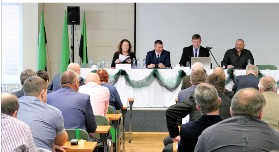
Nové svazové vedení řídí jednání I. sněhu