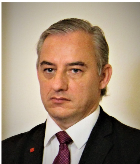
Josef Středula, předseda ČMKOS

Uplynulo třicet let a my můžeme hrdě konstatovat, že ČMKOS i s výrazným příspěvkem hornického odborového svazu vý-