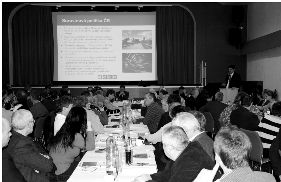
Záběr z jednání konference o dopadech vládní energetické a surovinové politiky na zaměstnanost v těžebním průmyslu.

V Domě PZKO ve Stonavě se konal 22. března 6. sněm Sdružení hornických odborů OKD. Jednání začalo netradičně už v 7 hodin aby od 10 hodin mohla proběhnout konference Dopady Státní energetické koncepce (SEK) na zaměstnanost v těžebním průmyslu.