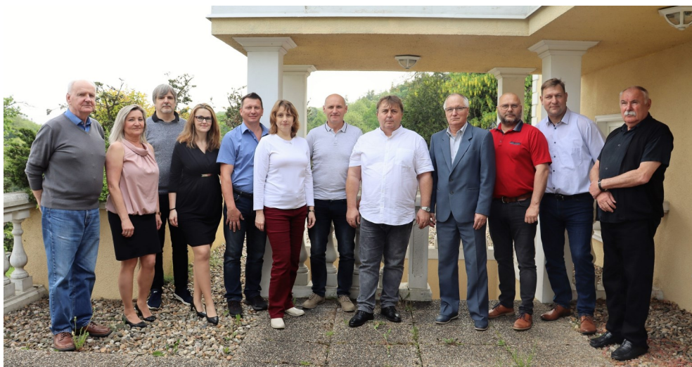
Společná fotografie hostů ze Slovenska s funkcionáři a zaměstnanci v sídle OS PHGN v Praze.

Pochopitelně u nás na Slovensku. Příští rok v březnu jsme pozvaní na jednání X. sjezdu OS PHGN do Luhačovic a poté přijede vedení vašeho odborového svazu k nám. Budeme se snažit, aby vzájemná spolupráce byla ku prospěchu odborářů a zaměstnanců našich odvětví. To je hlavní cíl.