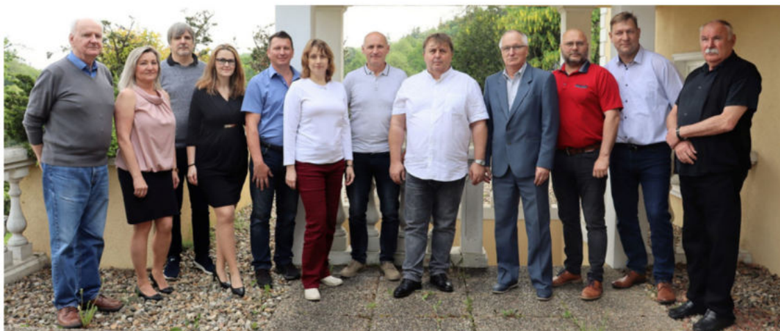
V rámci obnovení mezinárodní spolupráce po covidu-19 přijeli v roce 2023 do Prahy jako první Slováci.