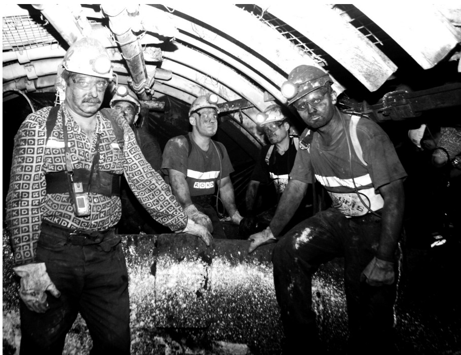
Záběr z porubu na Dole ČSM v OKD Ostrava